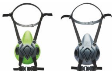
Meias máscaras BLS 4000next S - BLS 4000next R